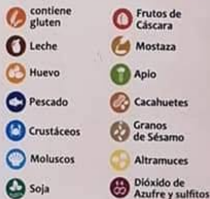
TABLA DE ALÉRGENOS